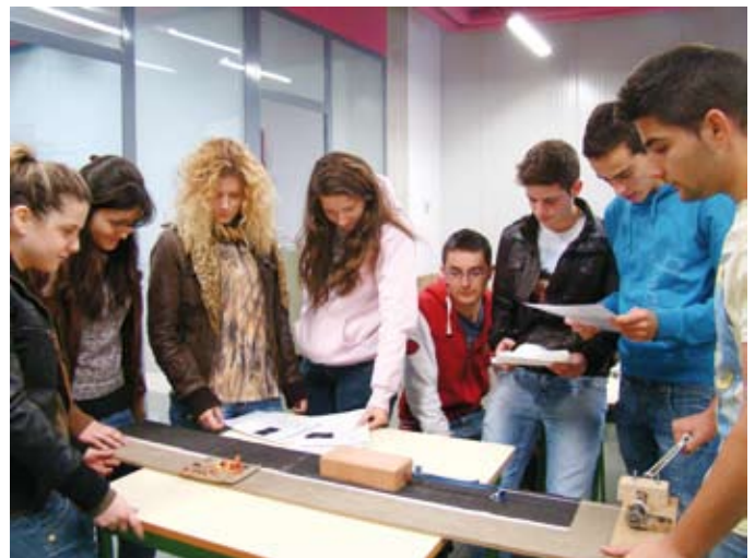
Figura 4. Detalle de la experimentación de la actividad La Máquina de Terremotos realizada en el Instituto Ramón Arcas de Lorca.

Quizás sea la más técnica y dirigida a alumnos de mayor edad, teniendo en cuenta su complejidad, pero su necesidad se justifica por la conceptualidad de la acción pedagógica. No se puede aprender aquello que no se entiende; y el ser humano, en términos generales, necesita ver y experimentar para creer. En Lorca y, posiblemente en otras zonas del sureste de España, los estudiantes han sufrido un terremoto. Sin embargo, a pesar de que pueden haber tenido esta experiencia, el pánico al sentir un terremoto puede limitar la capacidad de un observador para desarrollar de manera crítica y cuidadosa la comprensión del fenómeno. Esta actividad, junto con algunas otras de las aquí presentadas, se ha testado con estudiantes del Instituto Ramón Arcas de Lorca (figura 4).