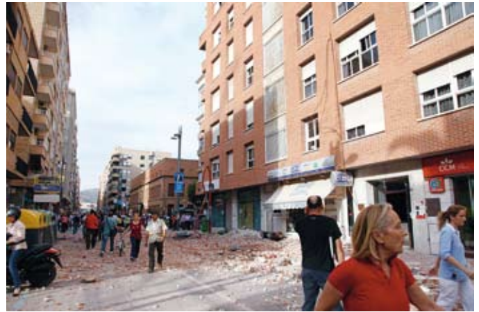
Figura 2. Detalle de la caída de elementos no estructurales de las fachadas responsables de la totalidad de las víctimas mortales.

Con 92.869 habitantes (según INE de 2011), la población en Lorca se va incrementando y aumentando en ella la proporción de inmigrantes, sin cumplir con la tendencia generalizada de envejecimiento de la Región de Murcia. Esto conlleva una población estudiantil muy alta. En relación con este hecho, la casi desaparición de los contenidos de Geología en los