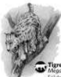
Tigre diente de sable Megantereon cultridens. Falso de la variedad 'macarodentino' de gran talla. Nunca antes se habían hallado restos fósiles de esta especie en Europa occidental.

Un lugar lluvioso La actual comarca de Guadix, un semidesierto de badlands donde avanza la erosión, tenía hace dos millones de años un régimen de lluvias intenso, con inviernos exentos de temperaturas extremas