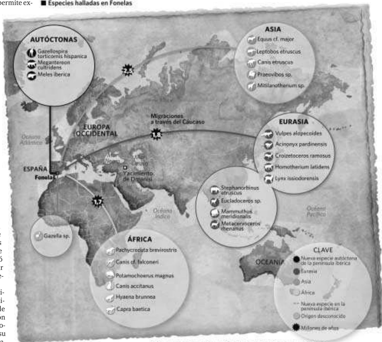
Fuente: Mundo perdido en Granada, PLoS One, Instituto Geológico y Minero de España. Gráfico: A. Labán, Cristina G. Rivera, Dpto. Infografía.