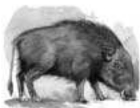
Jabali de río Potamochoerus magnus nov. Nunca había sido registrado fuera de África. En el Plioceno de Afar (Etiopía) se descubrió una especie similar a la de Fonelas, aunque de menor tamaño.