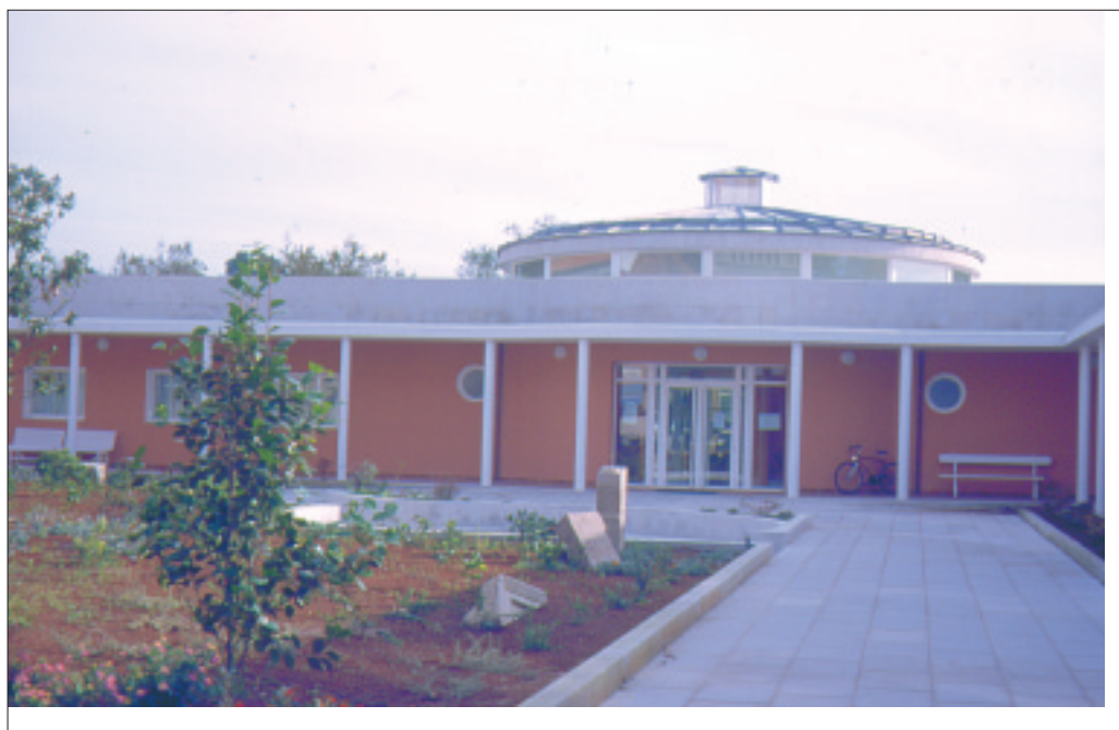
Termas de Cuntis

Las Termas o Caldas de Cuntis están constituidas por tres fincas: una tiene un edificio (A Virxe) construido en 1.810, ampliado posteriormente y reformado desde los años 60, utilizándose actualmente como hotel; otro colindante (O Castro), antigua casa de baños situada en un magnífico jardín con un frondoso bosque, que se extiende