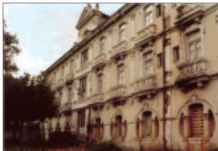
Termas de Carballiño